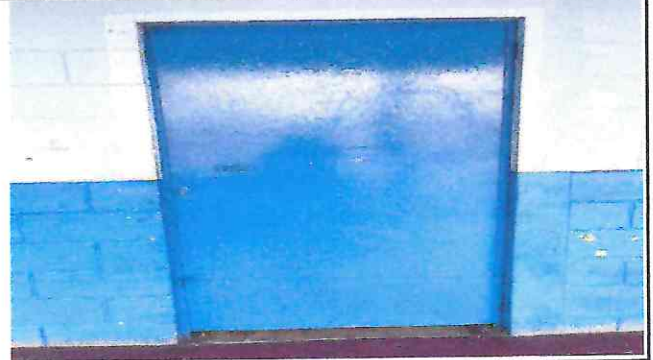
Foto 4. Sustitución de chapa de puerta de cocina en mal estado