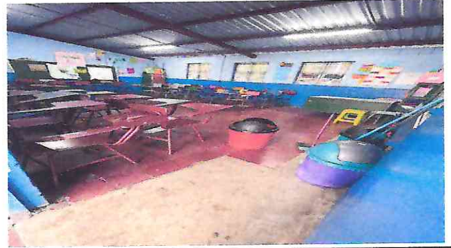
Foto 2. Sustitución de piso de color en aulas en mal estado, por piso de granito