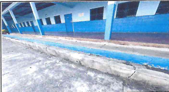
Foto 3. Remozamiento de gradas de patio en mal estado