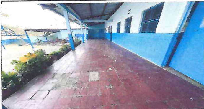
Foto 1. Sustitución de Piso de color de corredor en mal estado, por piso de granito.